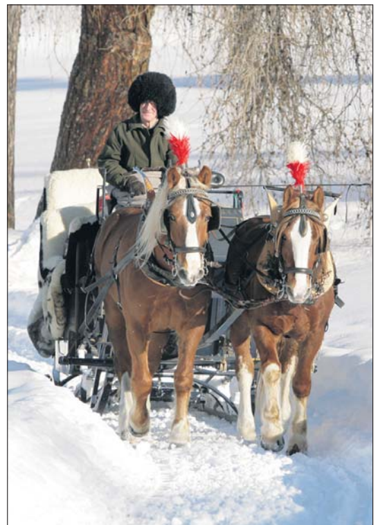
Bei einer Schlittenfahrt geniessen die Gäste die tief verschneite Landschaft.

Einen höheren Bekanntheitsgrad. Die ASRE (Association Suisse des Randonneurs Equestres) leistet dabei viel Pionierarbeit.