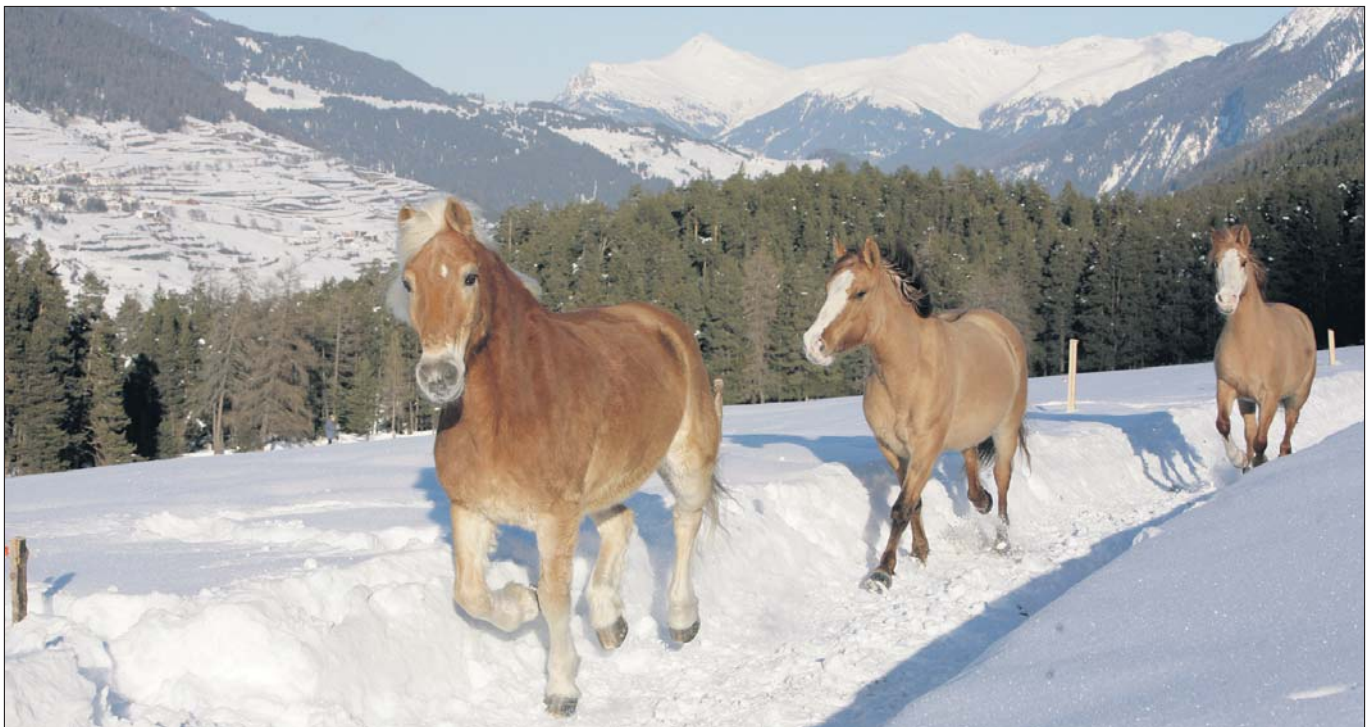
Stiebender Schnee unter schnellen Pferdehufen vor eindrücklicher Bergkulisse sind ein einmaliges Erlebnis.

(Scuol), wo sie am 2. Juni 2007 eintrafen, genau 5000 Tage nachdem der Reitbetrieb einst eröffnet wurde. «Die Reise war ein unvergessliches Erlebnis. Unter-